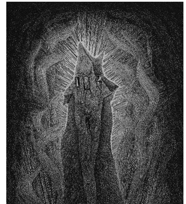
Phantasien über ein altes Haus: Dämon, 1918