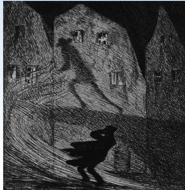
Fieber: Schatten, 1919, Privatbesitz