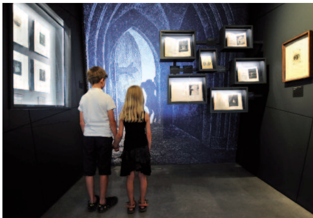
Abteilung Fritz Schwimbeck, Museum im Wittelsbacher Schloss

Schwimbecks Grafiken faszinieren durch ihren geheimnisvollen Charakter, hervorgerufen durch gezielt eingesetzte Lichtquellen und bewegte Schattengestalten.